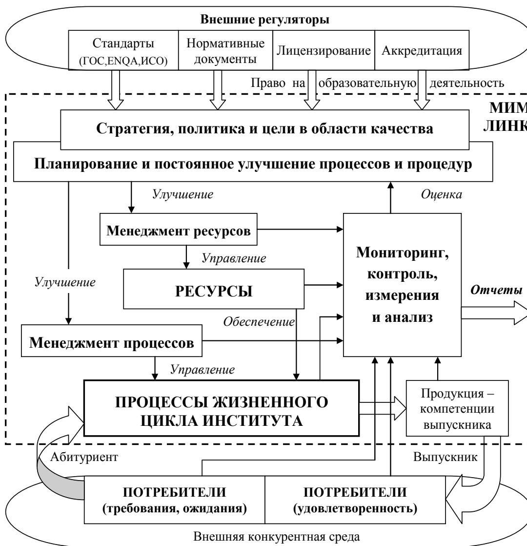
Рис. 2.1. Модель системы качества МИМ ЛИНК

В основу разработанной и внедряемой в институте системы качества (СК) положена Типовая модель, соответствующая требованиям «Стандартов и директив ENQA» и ISO 9001 (рис. 2.1).